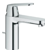
Grohe Eurosmart Cosmopolitan wastafelmengkraan M-Size