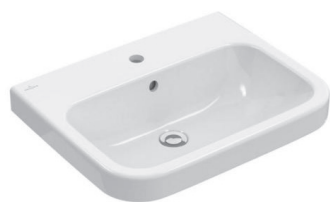
Villeroy & Boch wastafel Architectura wit 60 x 47cm