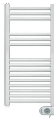
elektrische radiator 78 x 40 cm