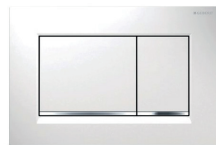
Geberit Sigma 30 wit/glanzend/wit