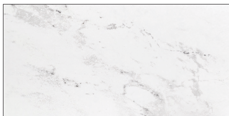
marmers wit glans