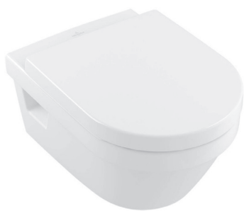
Villeroy & Boch wandcloset Architectura directflush wit Pack incl. closetzitting softclose en quick release