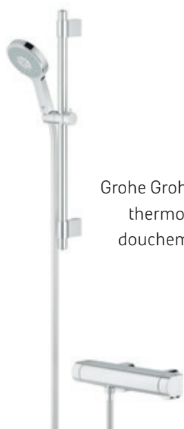
Grohe Grohtherm 2000 thermostatische douchemengkraan