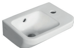
Villeroy & Boch fontein Omnia Architectura wit 36,5 x 26 cm